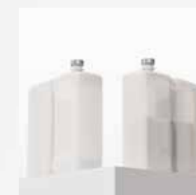
Utan AAC Med AAC

Minska förbrukningen av lösningsmedel med upp till 42 % med inbyggd Active Airflow Control-teknik (AAC) som tillval, vilket ger lägre driftkostnader och färre påfyllningar av lösningsmedel.